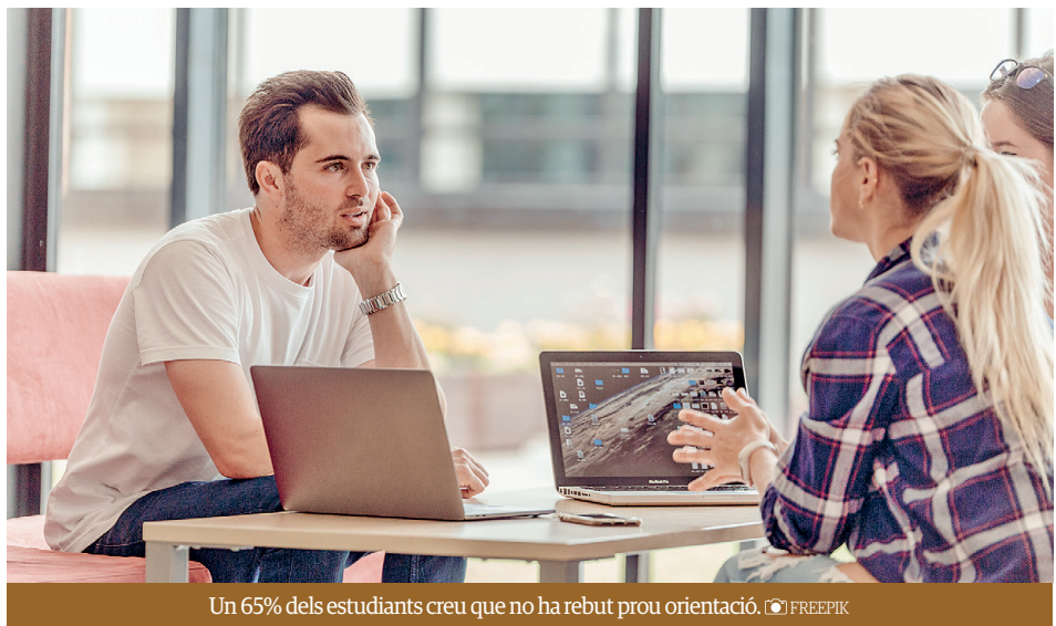
Un 65% dels estudiants creu que no ha rebut prou orientació.

Aquest estudi s'ha dut a terme en vuit ciutats catalanes, sent una d'elles Tarragona. I les conclusions demostren que el fet d'haver participat en programes d'excel·lència en orientació liderats pels departaments d'Educació, amb la implicació de les àrees d'Empresa i Ocupació i Joventut, ha permès tenir, en primer lloc, una visió molt més profunda de la realitat socioeconòmica i laboral de l'entorn local, cosa que ha donat inputs a les escoles. Així mateix, el fet participar en un programa municipal ha obligat als centres educatius participants i tenir un compro-