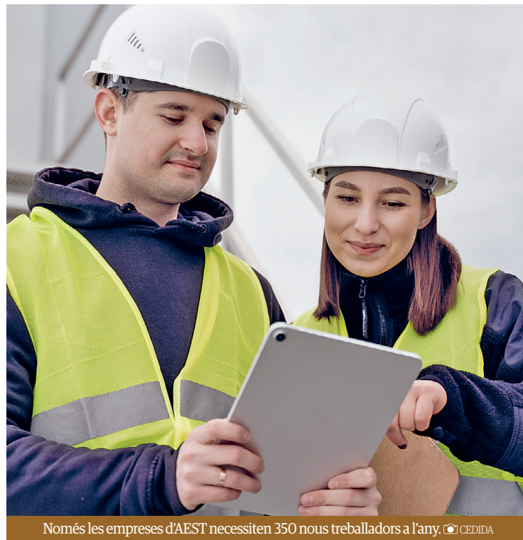
Només les empreses d'AEST necessiten 350 nous treballadors a l'any.

Les empreses de manteniment industrial i serveis auxiliars no troben professionals qualificats i això complica el relleu generacional